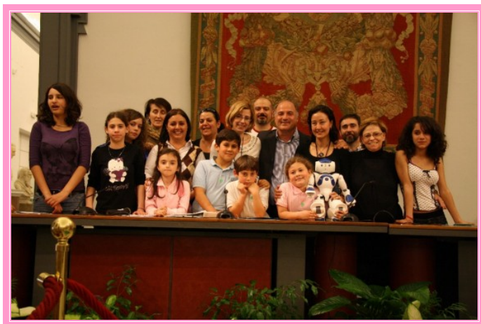
Foto di gruppo al Campidoglio, Roma