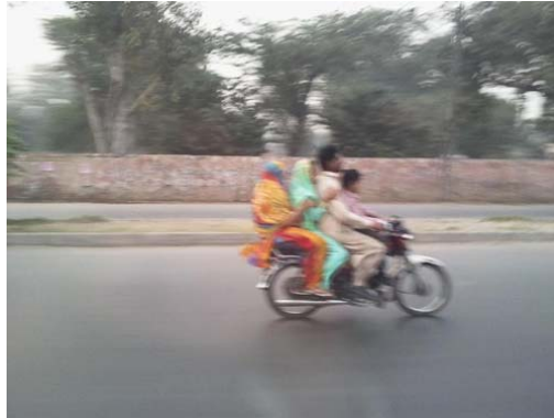
Pakistan: "negozio dei tessuti" e "andando in moto"