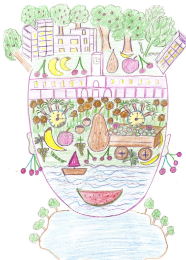
Viaviana Rieti, Allegoria di Latina

Nera Come Dolorose E Era Esperienze Lugubre L' Latina Palude Anofele Finalmente Assonnata Rabbiosa Unita Solitaria Adesso Troneggia Senza Dopo Unica Anima Infinite Regina Tanto Collaborazioni Orgogliosa Oscura E