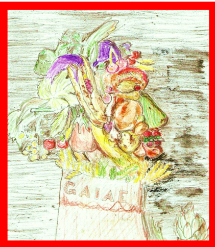
Gaia Reali (G. Arcimboldi, Allegoria dell'estate )