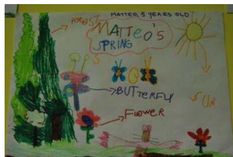
MATTEO, 5 YEARS OLD, "SANTA GIULIA SALZANO" SCHOOL

CRISTINA, 7 YEARS OLD, "N. PRAMPOLINI" SCHOOL