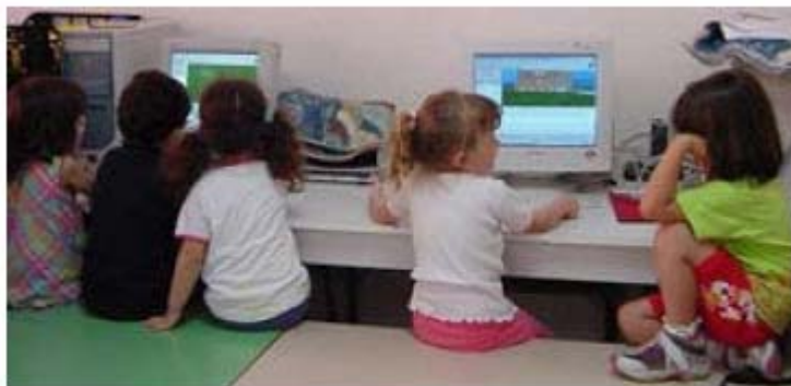
Bambine/i di 3-4-5 anni nei mondi virtuali

Fra i tre tipi di chat sicuramente quella che preferisco e' quella relativa alla costruzione di mondi virtuali, per una serie di motivi. Il primo motivo e' quello della condivisione di uno spazio e la creazione di un mondo alternativo da parte di bambini o la scoperta di spazi alternativi, con la possibilita', ovviamente, di sperimentare le forme di scrittura testuale.